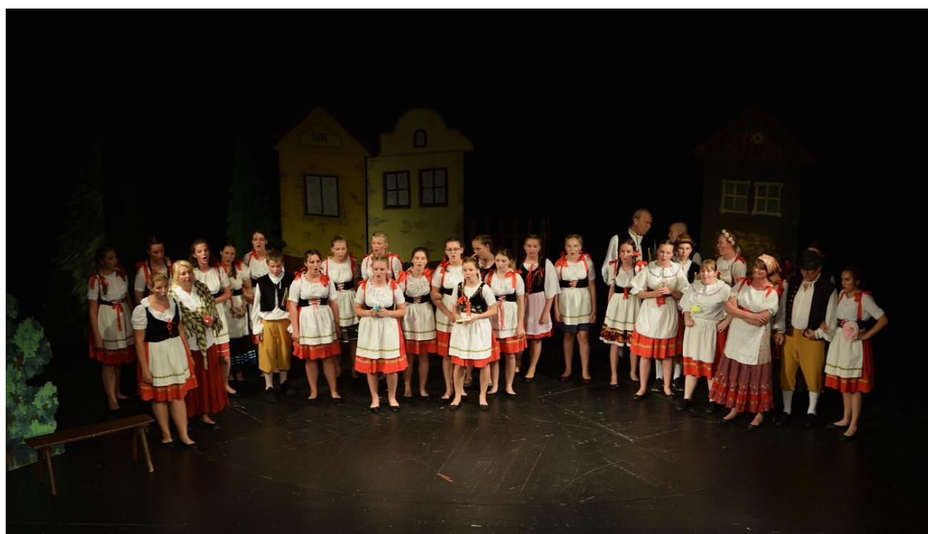
Premiéra se konala 20. června 2019 v Hálkově divadle