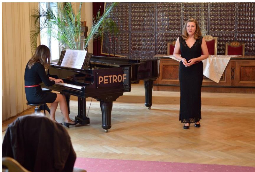
Z koncertu bývalých absolventů školy

18. dubna 2016 se uskutečnil Slavnostní koncert bývalých absolventů školy