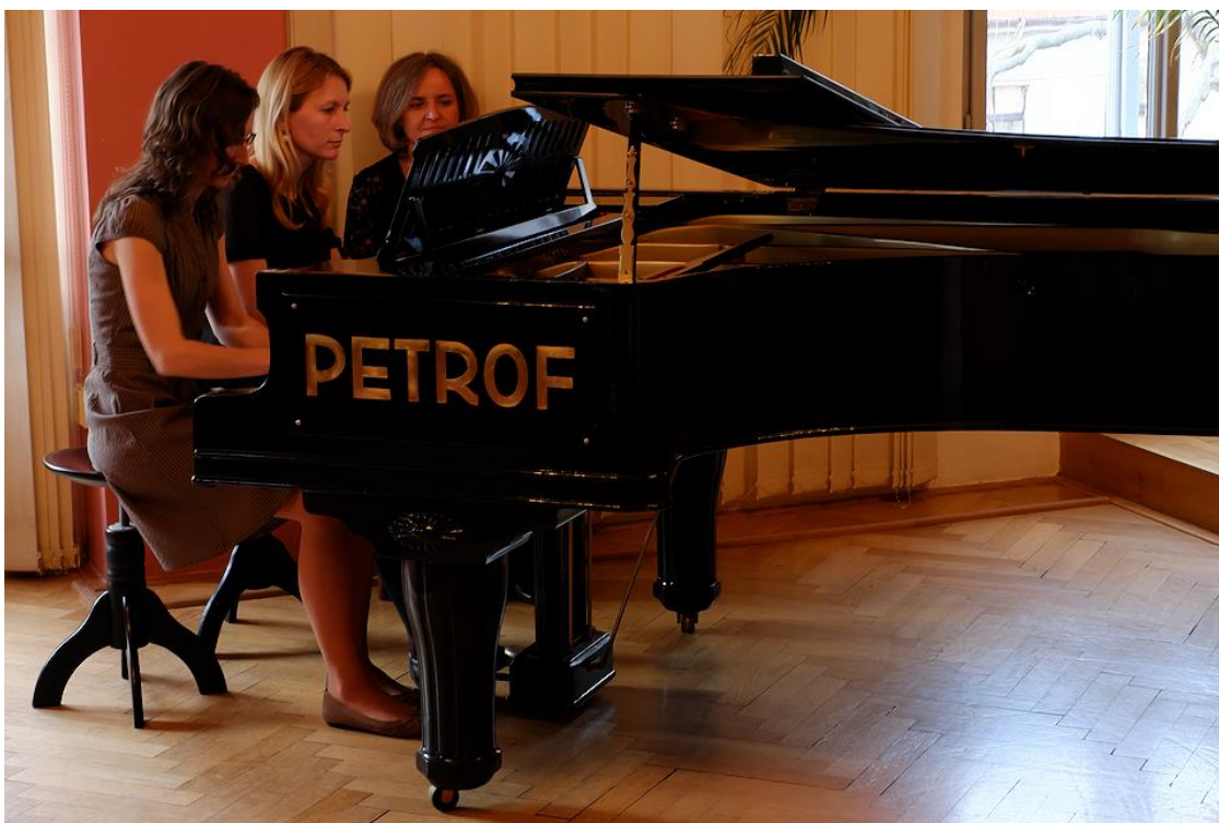
Na klavír hrají bývalé absolventky školy

Setkání s bývalými pedagogy a zaměstnanci školy, spojené s krátkým koncertem a malou výstavkou prací výtvarného oboru se uskutečnilo dne 10. června 2016 V Obecním domě Nymburk.