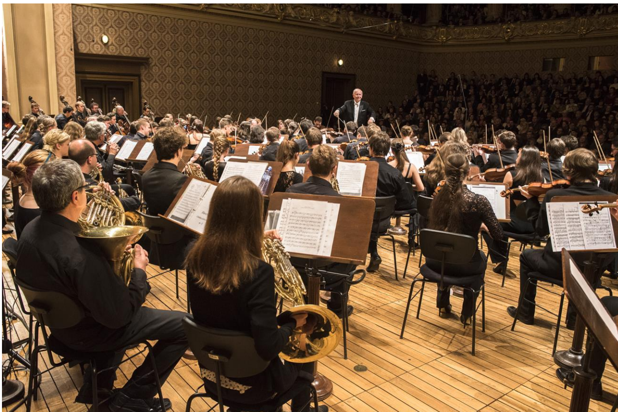
Orchestr České filharmonie a žáků ZUŠ dirigoval Jiří Bělohlávek