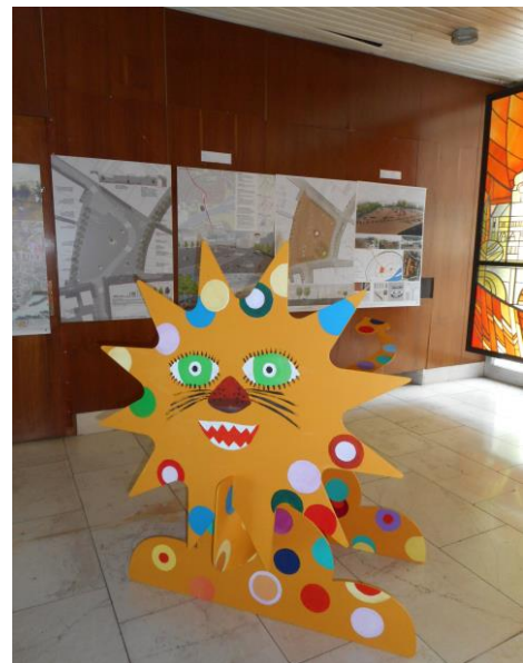
Dřevěné safari – lvi pro safari v ZOO Dvůr Králové