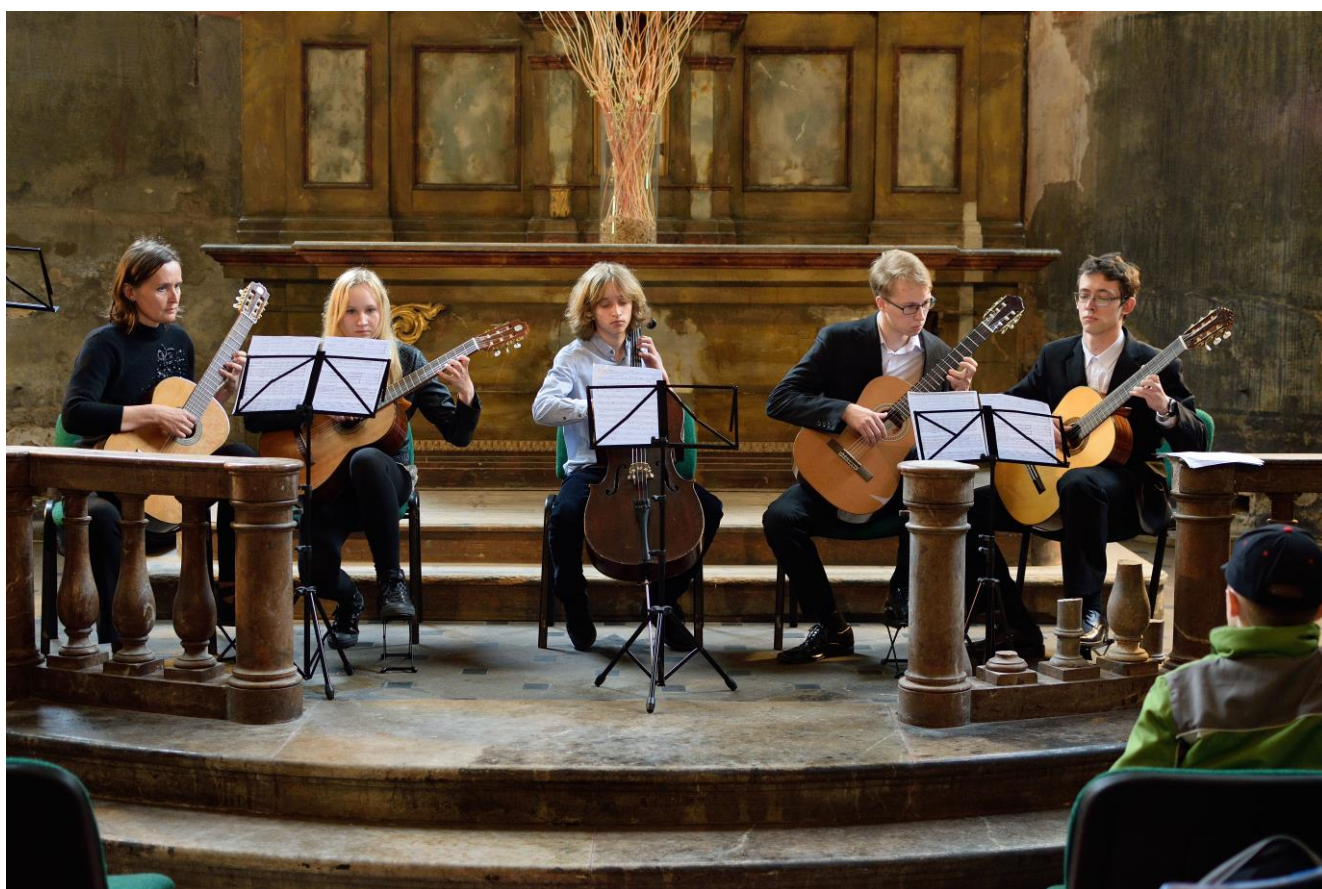
Koncert v kapli sv. Jana Nepomuckého