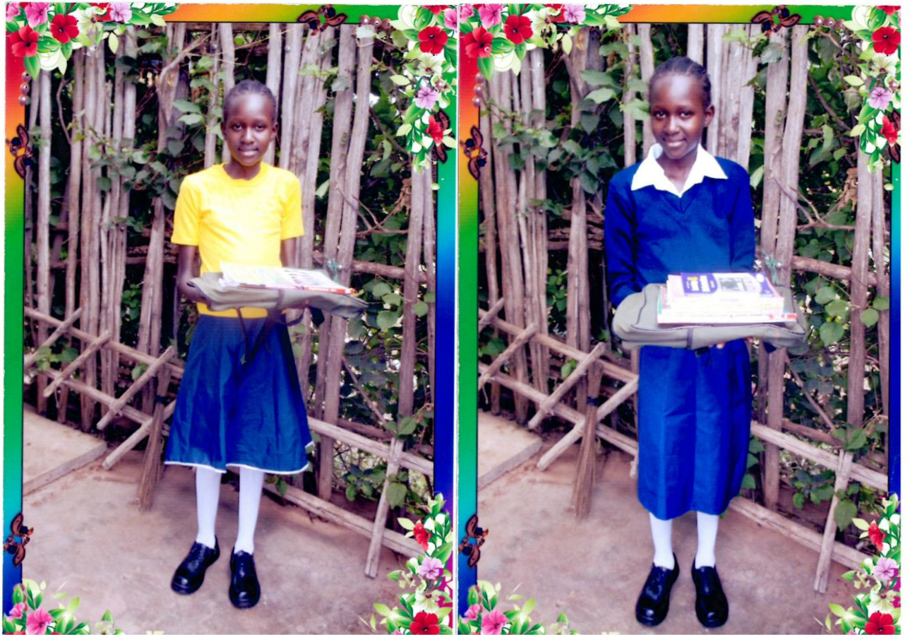
Takto prosívá a roste naše adoptivní africká holčička.