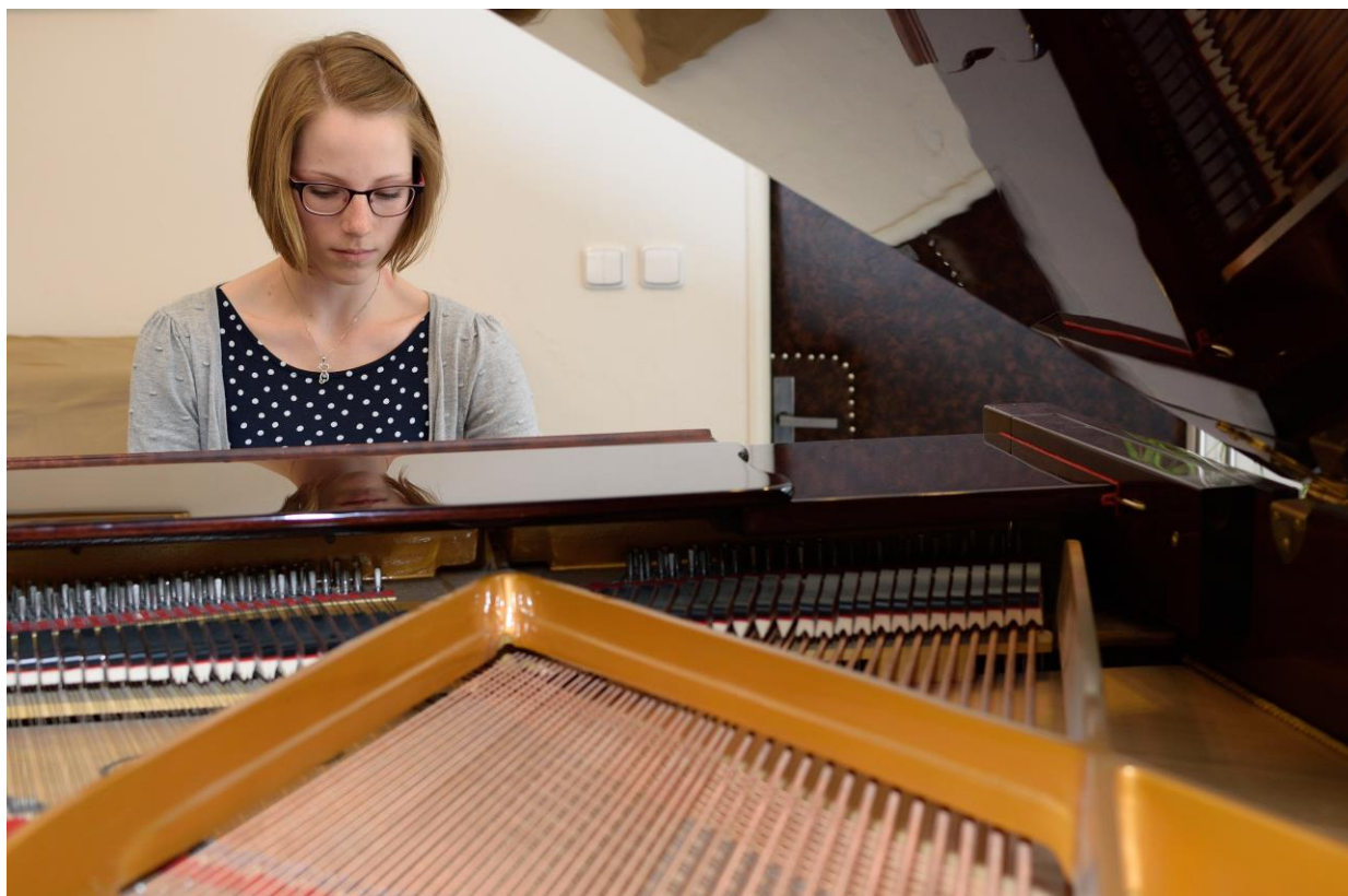
Z klavírního koncertu v sále školy.